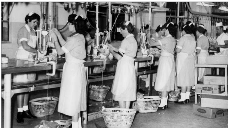
Die frühen Anfänge: Mitarbeiter von Shen-Valley Produce in Virginia bei der Verwendung des ursprünglichen Tipper Clipper zum Clippen und Verschließen von Würstdärmen.

Mitte der 1970er Jahre entwickelte TIPPER TIE eine vollautomatische, rotierende Verpackungsmaschine, auf die Schrumpfbeutel aufgezogen und dann mit einem speziellen Tipper Clipper verschlossen wurden. Die direkte Verbindung zwischen Clipper und Verpackungsmaschine war eine weitere Innovation, mit der der Clip-Vorgang effektiv direkt in den Gesamtproduktionsablauf integriert werden konnte.